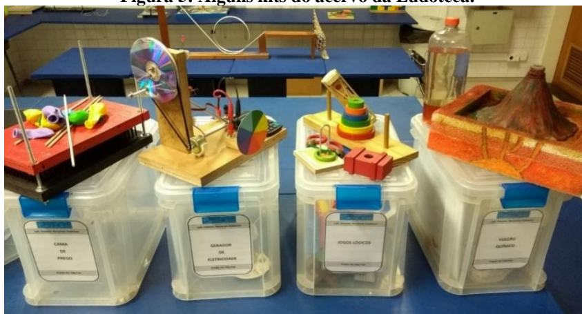
Figura 5: Alguns kits do acervo da Ludoteca.