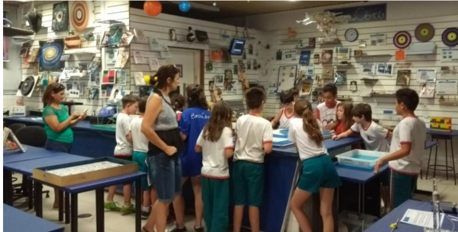
Figura 3: Laboratório de Desenvolvimento de Recursos Didáticos em Ciências da Natureza