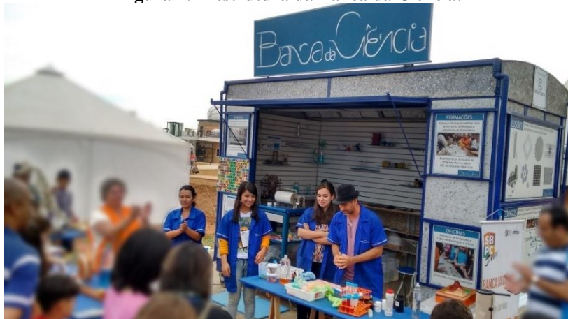
Figura 4: A estrutura da Banca da Ciência.