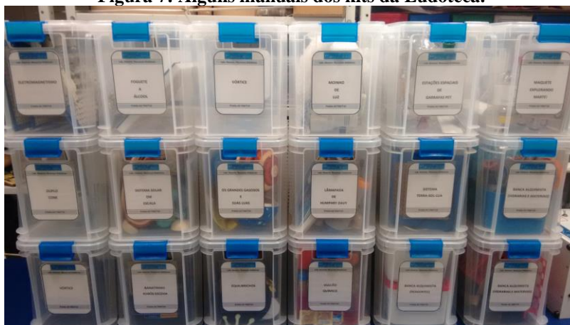
Figura 7: Alguns manuais dos kits da Ludoteca.

Uma das principais diferenças entre os kits da Experimentoteca e os desenvolvidos atualmente na Ludoteca da Ciência está na alocação, facilitando o transporte em ações de divulgação científica. Enquanto os kits da Experimentoteca são grandes e acondicionados em pesadas caixas de madeira, os kits da Ludoteca da Ciência são acondicionados em caixas plásticas transparentes com volume e peso bem menores (figura 6), na dimensão (25cm.h x 23cm.L x 38cm.C). Desenvolvemos este tipo de armazenamento, pois, temos as vantagens de transportar a qualquer lugar como por exemplo em estações de trem e metrô, corredores e quadras de escolas, sala de aula, praças públicas, parques, laboratórios e ambientes externos de universidades entre outros lugares.