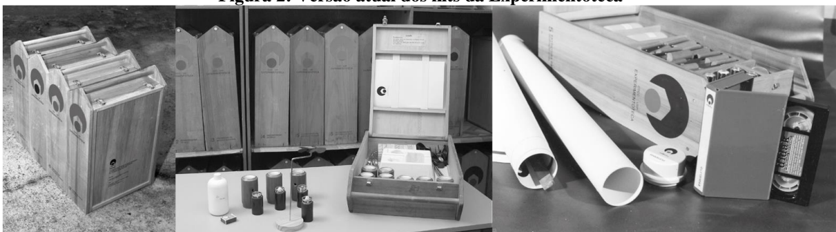
Figura 2: Versão atual dos kits da Experimentoteca

Segundo Mori & Curvelo (2014), a Experimentoteca do CDCC é constituída por kits distribuídos em 102 conjuntos temáticos (64 para o Ensino Fundamental e 38 para o Ensino Médio) nas áreas de Matemática, Biologia, Física e Química. Cada conjunto é formado de modo que possa ser usado por 10 grupos de alunos simultaneamente, sem a necessidade de laboratórios ou de qualquer infraestrutura especial (figura 1). Os temas abordados abrangem grande parte do conteúdo de Ciências dos Ensinos Fundamental e Médio.